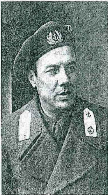
Valerio Borghese, il Comandante dell'Onore che non vuole essere « onorevole ».

Il Comandante Valerio Borghese, uno dei massimi protagonisti della RSI ha rifiutato il posto in lista per le Camere. Come dopo l'8 settembre 1943, disse « no » a Badoglio portando alla Repubblica Sociale le forze e la fede della « Decima Flottilgia Mas », così adesso ha detto « no » al partitismo, rifiutando di avallare con il suo nome questo sistema fallimentare. Il suo gesto lo conferma ancora una volta quale Capo degli italiani disposti a battersi contro ogni regime corrotto e corruttore.