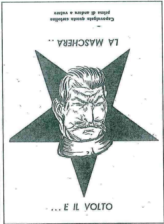
Una "maschera" lanciata dagli anticomunisti. Il volto di Garibaldi (simbolo del Blocco del Popolo PCI-PSI), capovolto, diviene "Stalin".