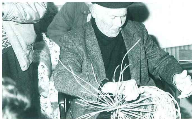
Incontro con gli anziani del Centro Diurno - L'intreccio