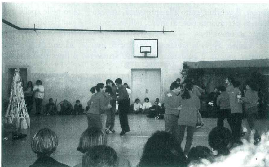
Gli alunni della 3 a C danzano una polka americana nel corso di una manifestazione per lo scambio degli auguri natalizi