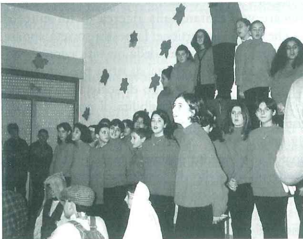
Gli alunni della succursale di Bonagia eseguono alcuni canti natalizi