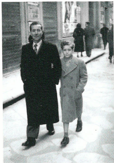
1949 - Con mio padre in via Garibaldi.