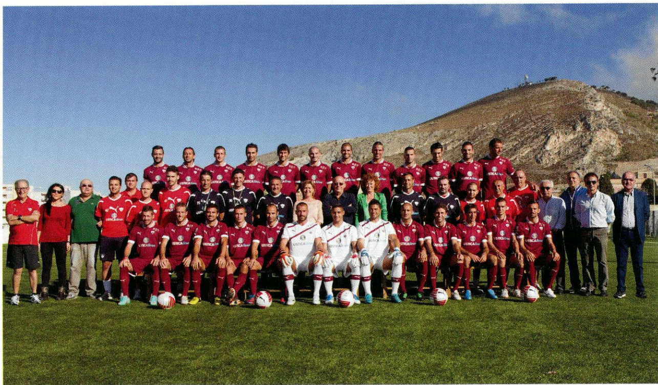
Stagione 2012-13. Il Trapani Calcio al completo si avvia verso la serie B.