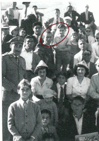
1 Maggio 1949 - La mia prima partita al campo Aula.