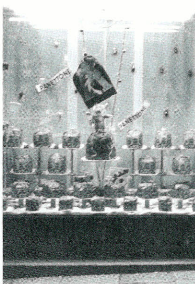
La vetrina dell'antica pasticceria "Fiorenzo" con i panettoni natalizi.