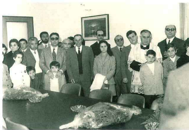
N° 186. 6 Dicembre 1970. "Cassa Rurale".