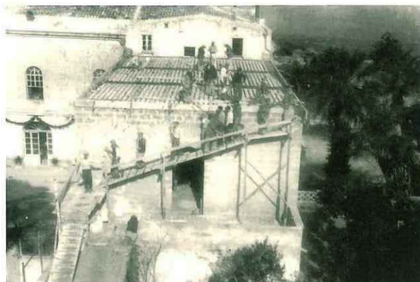
N° 184. Anno 1963. Villa Betania.