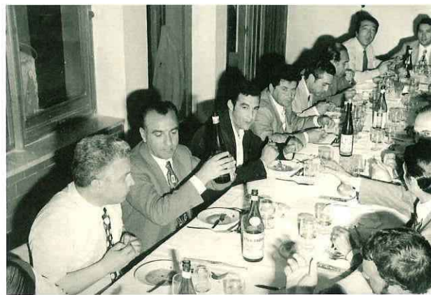
N° 188. 23 Settembre 1961. "Geometri trapanasi".