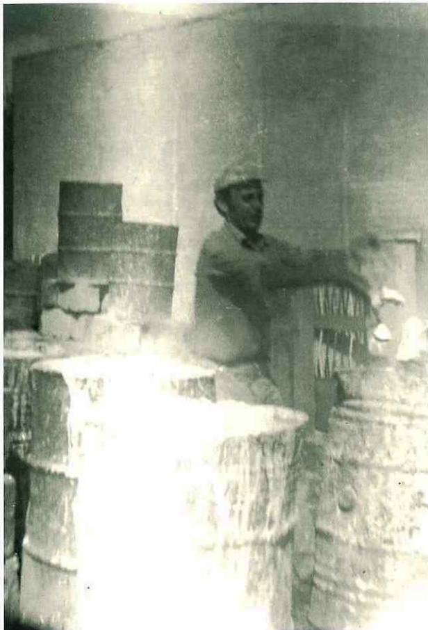
N° 179. Anno 1955. Si scioglie la calce in vecchi fusti.