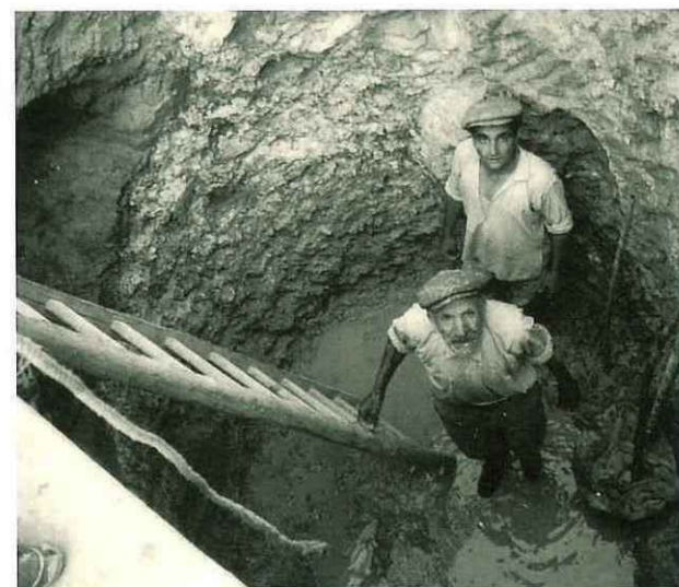
N° 192. Anno 1955. Si costruisce un pozzo all'interno di Villa Betania.