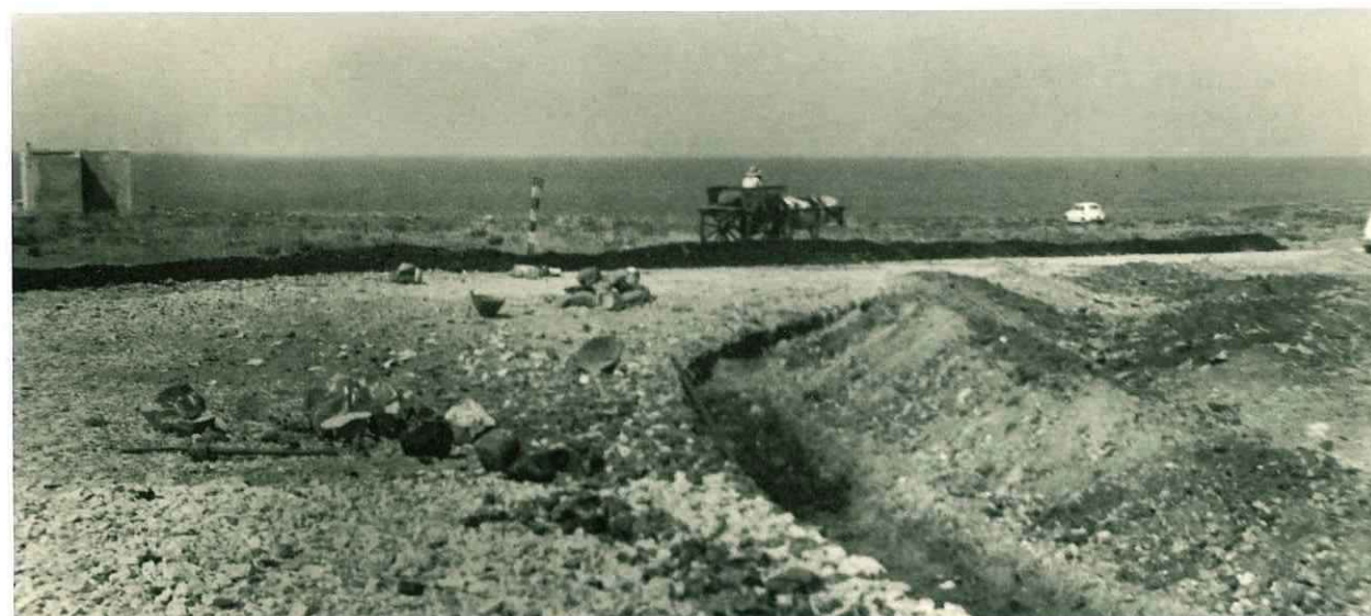
N° 198. Anno 1956. Cortigliolo (Lido Valderice)