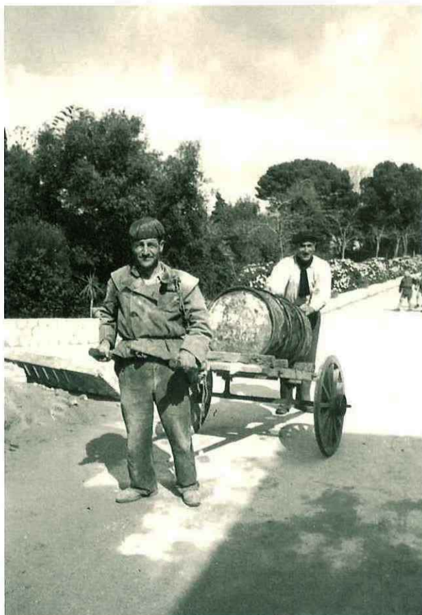
N° 182. Anno 1950. Villa Betania. Due operai.