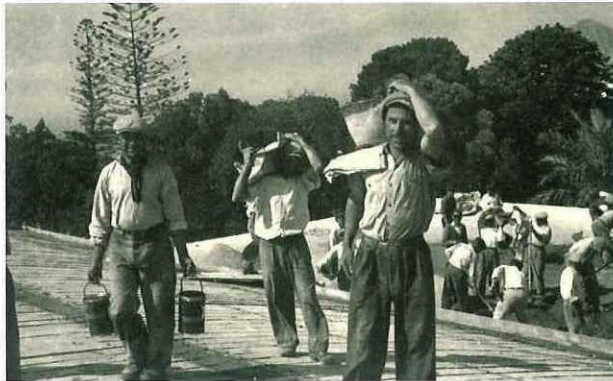
N° 180. Operai lavorano sul tetto di un edificio di villa Betania.