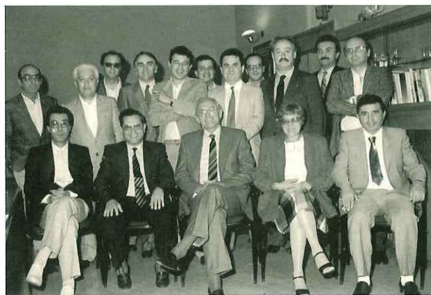
N° 187. Anno 1977. "Associazione industriali".