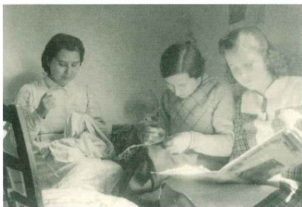
N° 185. Anno 1956. Donne che leggono e ricamano.