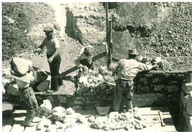
N° 181. Anno 1956. Villa Betania.