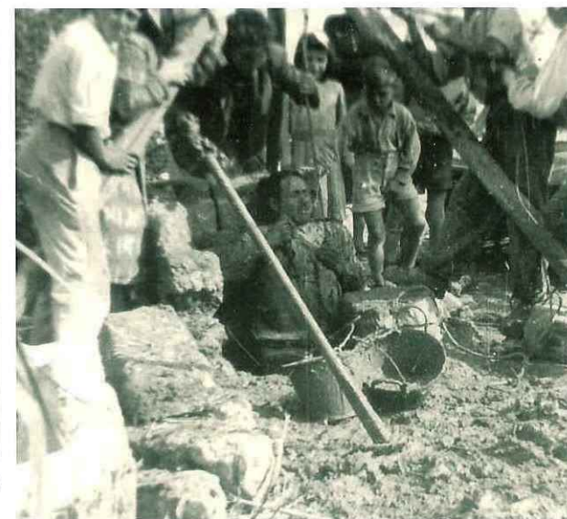
N° 193. Anno 1950. Crocevie. Si pulisce un pozzo.