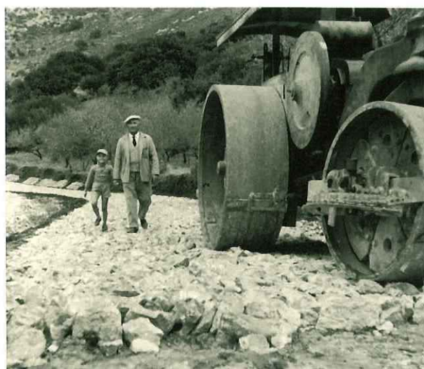
N° 196. Anno 1952 Costruzione della strada Immacolatella - Erice. Impresa Bulgarella.