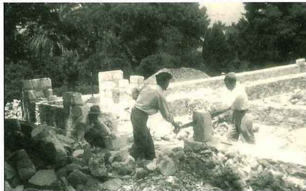
N° 183. Anno 1956. Si segano i tufi necessari per edificare una struttura di Villa Betania.