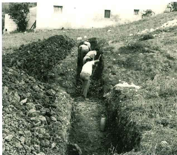
N° 197. Lavori di urbanizzazione a Crocevie anno 1954 - 1955