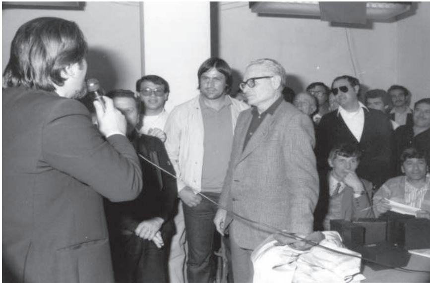
Ed ecco l'intervista al vecchio allenatore