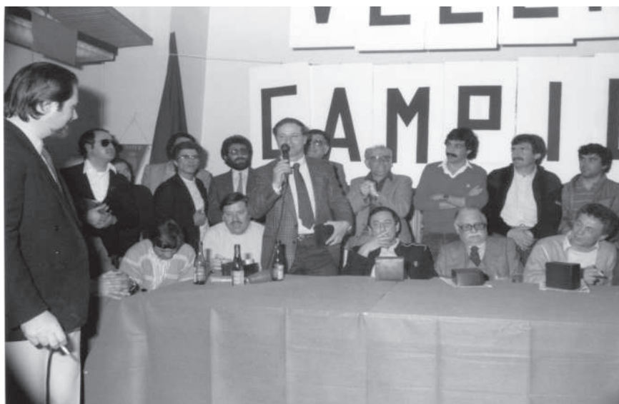
Capitan De Dura ringrazia