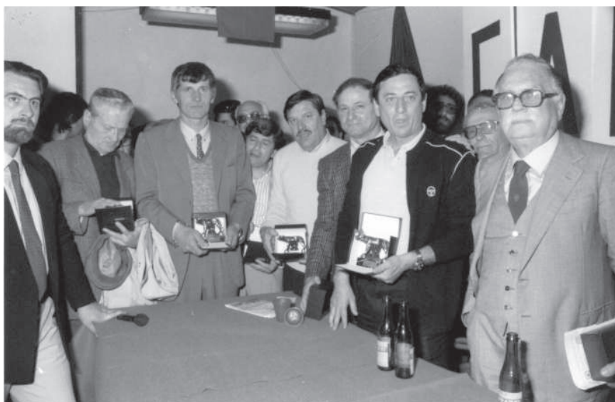
Si posa per la foto ricordo