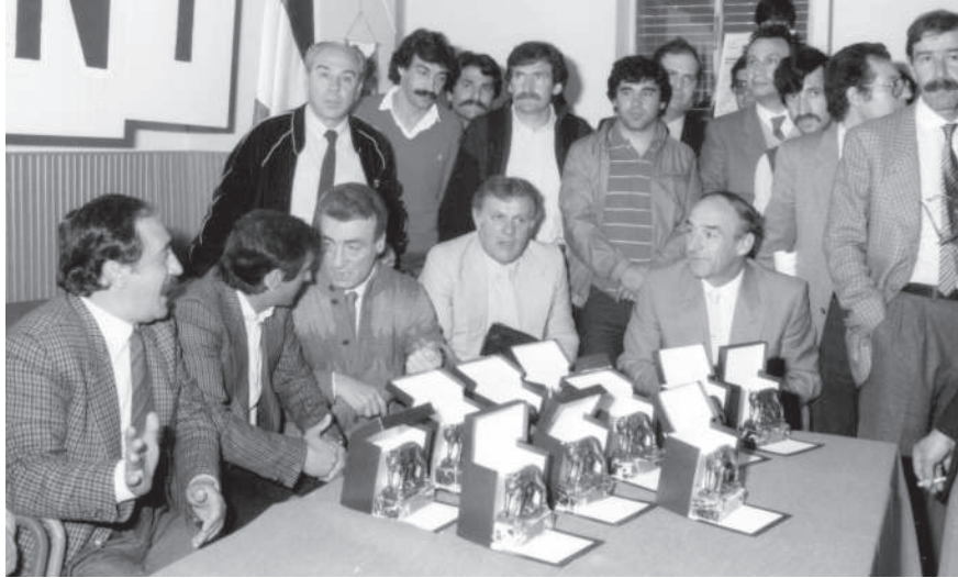
Ed eccoci all'interno del salone parrocchiale della chiesa di Santa Teresa a pochi istanti dall'inizio della cerimonia