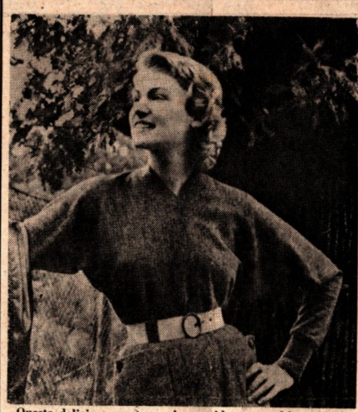
Questa deliziosa creatura, che sorride con occhi sognanti, non ci fa certamente rimpiangere, pur così pudicamente vestita, le folleggianti ondate della torrida estate.