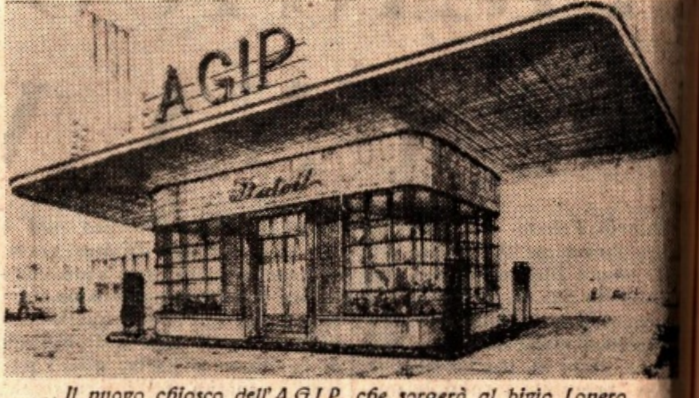
Il nuovo edificio dell'A.G.I.P. che sorgerà al bivio Lonero

Nell'ultimo tratto del marciapiede centrale della Via G. B. Fardella, e precisamente oltre il Bivio Lonero, sono in corso importanti lavori che contribuiranno notevolmente ad abbellire quella moderna e luminosa zona della nostra città ed a risolvere alcuni problemi di viabilità della zona stessa mettendo in alto opportuni accorgimenti che noi avevamo già tempo addietro in gran parte suggerito, occupandoci della questione su altro giornale.