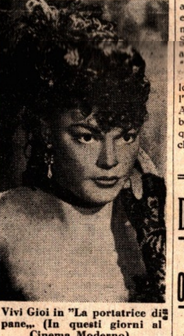
Vivi Gioi in "La portatrice di pane" (in questi giorni al Cinema Moderno)