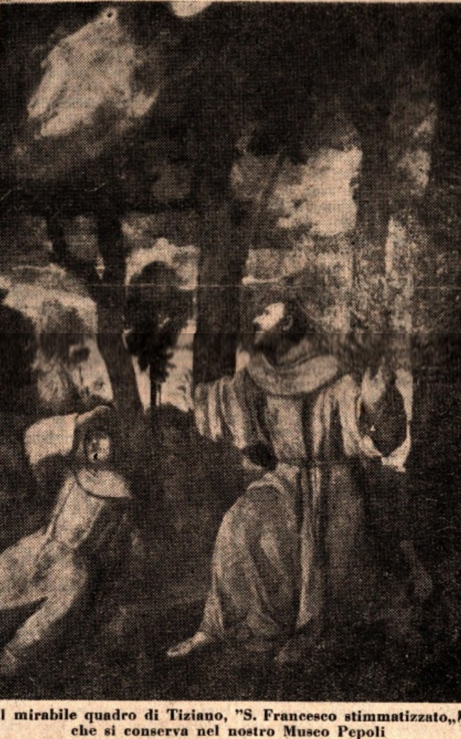
Il mirabile quadro di Tiziano, "S. Francesco stigmatizzato", che si conserva nel nostro Museo Pepoli

Non c'è turista o studioso o semplice visitatore del nostro Museo, che non resti sorpreso e a volte stupefatto durante e dopo la visita di esso; nessuno credeva trovare così ampi e nobili locali, così copiosa documentazione delle "Arti industriali, trapanesi, così alta qualità di dipinti, varietà di resili archeologiche, armonia plastico-architettonica di legni intagliati. Anche a conoscere, infatti, il pregevole "Itinerario, del Biagi (Libreria dello Stato-Roma 1935), è difficile immaginare la dovizia dell'insieme e il pregio particolare delle opere di arte qui raccolte.