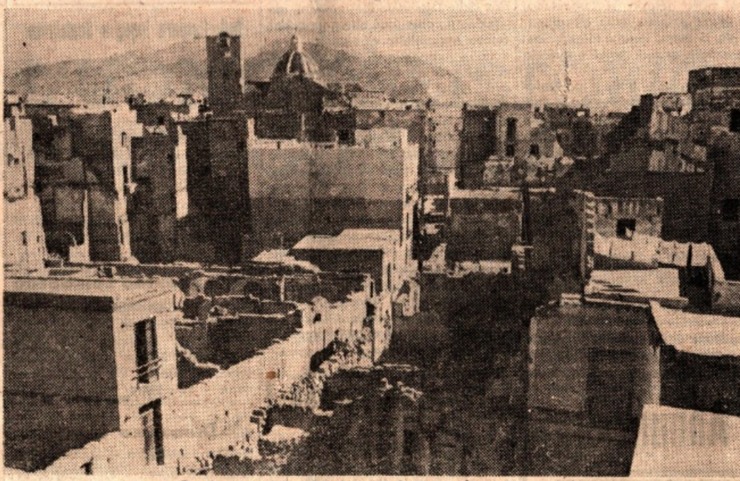
Desolato aspetto del rione di S. Pietro

Una massiccia pioggia di bombe americane distrusse nei due bombardamenti del 6 e dell'11 aprile del 1943 il rione di S. Pietro. Ogni segno di vita scomparve su un'area che si aggira attorno ai centomila metri quadrati. Quanti furono allora i morti? quanti i vani polverizzati? Sulle perdite umane nessuna seria inchiesta è stata finora condotta: c'è chi parla di tremila morti, chi di millecinquecento, chi addirittura a semella fa ascendere il numero delle persone che sono sparite sotto la micidiale pioggia assassina.