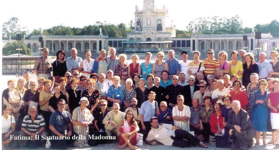
Fatima; Il Santuario della Madonna

"Vivere da pellegrini dovrebbe essere la condizione più naturale dell'uomo.