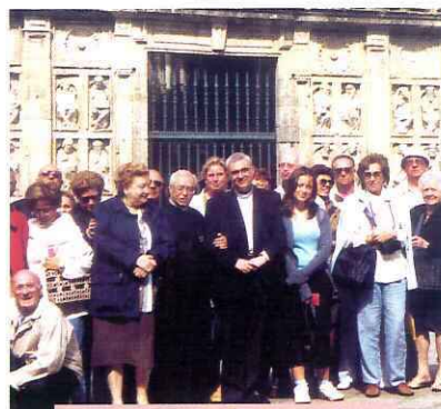
Santiago De Compostela: La porta santa