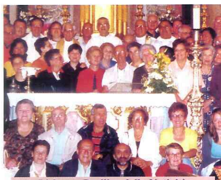
Lisbona: Basilica della Natività di S. Antonio di Padova.