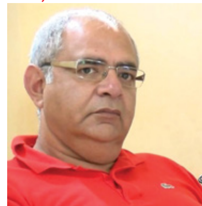
un passo indietro augurando alla stessa le migliori fortune”.

Allo stesso modo purtroppo oggi non vedo pari condizioni. Con la speranza che ci sia un futuro per la gloriosa Folgore, faccio