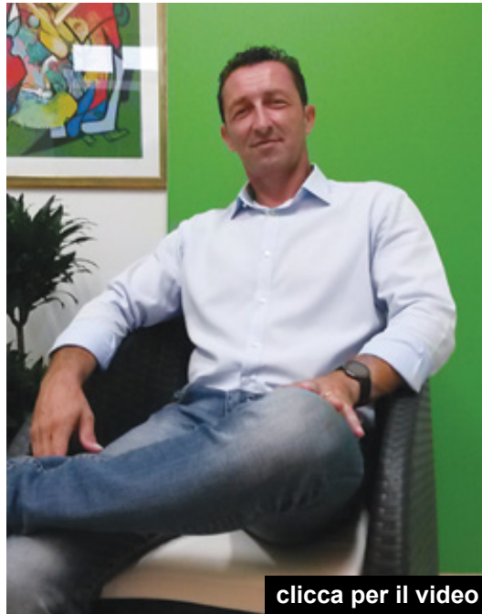
clicca per il video

In merito alle questioni politico-amministrative a Mazara del Vallo. “L'Amministrazione Cristaldi aveva una grande occasione ma non ha risposto alle esigenze del territorio. Noi con un solo consigliere comunale abbiamo fatto moltissime interrogazioni al Sindaco. Vogliamo parlare del “Piano di utilizzo del demanio marittimo”? Qualcuno ha cercato di sviare i cittadini dicendo che è stata colpa nostra relativamente ad una norma regionale, in realtà noi ci siamo opposti e non i partiti tradizionali. Le problematiche dei privati (vedi ad esempio la questione dei lidi) sorgono quando vi è mancata chiarezza del Comune e della Regione. Un altro problema simile è il Piano Paesaggistico: perché Mazara del Vallo non ha impugnato lo stesso Piano come hanno fatto Petrosino e Paceco? Altre questioni l'escavazione del porto canale e l'illuminazione del porto, sulle quali mi sono impegnato, hanno dimostrato come si è cercato di strumentalizzare le stesse questioni. Comunque un plauso di coerenza