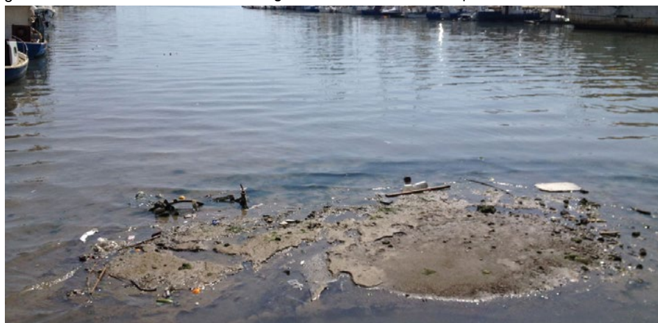
Portocanale Isola di fango