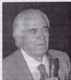
Il tenore Giuseppe Di Stefano

Notevole successo ha riscosso il concerto di gala tenutosi domenica 27 maggio presso il Teatro dell'Università di Trapani a conclusione della 8ª edizione del Concorso Internazionale Giuseppe Di Stefano «I giovani e l'opera».