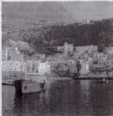
Porticciolo e scorcio panoramico di Favignana

portuali di Favignana, Levanzo e Marettimo, che costituiranno base per l'aggiornamento del piano regolatore del porto di Fa-