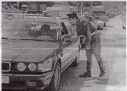
città ad alta densità mafiosa.

avere 120 unità di polizia. Sono solo cifre teoriche, ma servono ad evidenziare il fatto che sarebbe opportuno che, per una più intensa lotta alla mafia e alla piccola criminalità, il commissariato alcamese avesse una maggiore presenza di poliziotti.