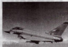
Un Eurofighter 2000

le circolazione del traffico civile creando ulteriori presupposti per un vero e proprio rilancio dell'aeroporto «Vincenzo Florio» e dell'economia provinciale nel suo