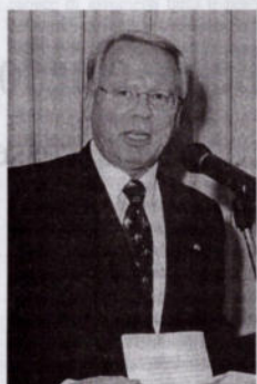
Fritjof von Nordenskjöld durante il suo intervento

potrà rivestire un ruolo importante, sia al suo interno che all'esterno, secondo le ambizioni di noi