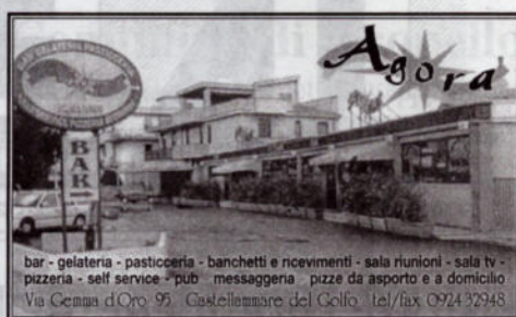
bar - gelateria - pasticceria - banchetti e ricevimenti - sala riunioni - sala tv - pizzeria - self service - pub - messaggeria - pizze da asporto e a domicilio Via Gemma d'Oro 95 - Castellammare del Golfo - tel./fax 0924 39248

Le scinnute, come è noto, si svolgono nella chiesa del Purgatorio alla presenza del Vescovo, che a conclusione celebra la S. Messa.