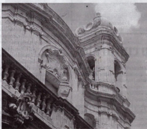
Parte del prospetto della cattedrale, meta dei pellegrinaggi giubilari

Non c'è dubbio che si sia trattato di un avvenimento importante sotto molti profili, che ha stupito un po' tutti, credenti e non credenti, per la massiccia presenza dei fedeli che hanno partecipato agli eventi che si sono succeduti con ritmo incalzante. Nella nostra diocesi, in particolare, sono stati 57 gli appuntamenti principali e 23 le categorie sociali direttamente coinvolte nella celebrazione del Giubileo. Ma quello che ha impressionato di più sono stati i pellegrinaggi, ai quali hanno partecipato migliaia di persone di ogni età e condizione, che hanno avuto come centro di propulsione le varie parroc-