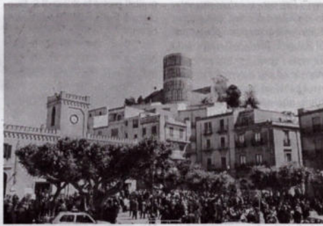
La piazza di Salemi con scorcio panoramico e torre del castello

logica e politicamente corretta. Ci risulta, tra l'altro, che anche da qualche diessino recentemente era stata avanzata la medesima proposta. Occorre ricordare