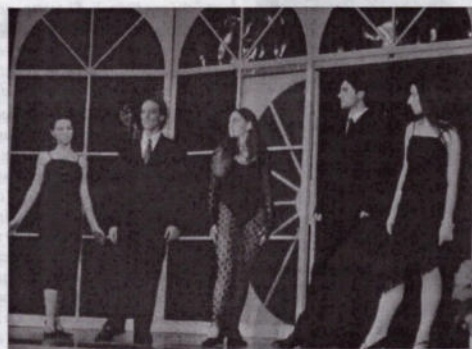
I ballerini della «Agliaia» nei complimenti finali

Un tipo di "teatro musicale" in cui il gesto, la danza, il suono, la musica, il canto, la luce, gli oggetti acquistano ogni volta un significato diverso, per poi perderlo e farne nascere un altro. L'intenzione è quella di evidenziare il tessuto onirico e fantastico de "Un tuffo nel vento" attraverso un lavoro coreografico e di messa in scena che ne riutilizza gesti, colori, oggetti, sostenuto da una ricerca musicale che utilizza il lavoro di Finella Mirto combinandolo con le sue sonorità, proprie della vita della coreografa.