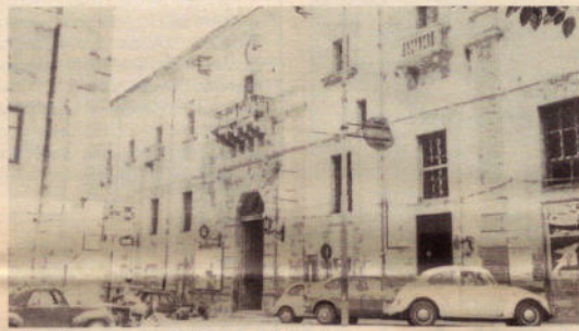
Municipio di Castellammare

elettorale poiché ha detto di ritenere che tale difficile situazione scaturisce anche da un difetto di tale legge che «spesso crea maggioranze diverse tra il sindaco ed il consiglio comunale».