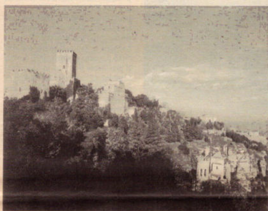
Suggestiva veduta di Erice

della solidarietà» illustra ed esalta Erice, la cittadina del trapanese appollaiata sulla vetta del monte omonimo, già San Giuliano, ricca di storia, di arte e di incantevoli panorami.