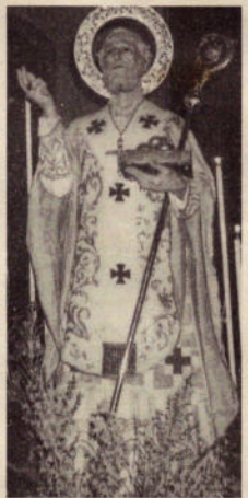
La statua del Santo