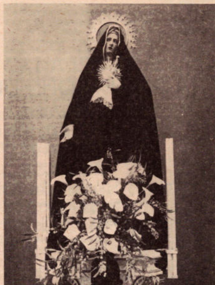
L'Addolorata del Milanti (ceto dei camerieri e baristi)

Quando il corpo sarà morto, fa' che l'anima abbia porto - di Paradiso e gloria.