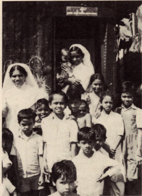
Due "Sorelle del Sorriso" con un gruppo di bimbi accanto ad una povera "baracca" adibita ad ambulatorio-dispensario per la cura e la prevenzione non solo della lebbra, ma di innumerevoli malattie presenti in questi sovrappopolati "slums" (Jogeshwari, estrema periferia di Bombay - India)