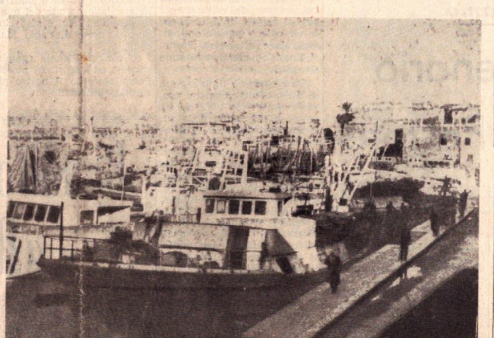
Uno squarcio della flotta peschereccia di Mazara

MAZARA — Viva e l'attesa degli operatori e delle organizzazioni dei lavoratori del mare per l'imminente ratifica del trattato che sancirà gli accordi per la pesca nel canale di Sicilia. È scaduto in fatti il trattato stipulato il 1° febbraio 1963 dai rappresentanti dei due governi ed il conseguente protocollo aggiuntivo del 1967. Non si nutrono molte speranze e rita la possibilità di risolvere tutti gli annosi problemi che si pongono durante il duro lavoro svolto dai nostri pescatori nello specchio d'acqua prospiciente il continente africano. Infatti difficilmente il prossimo accordo potrà sancire uno spirito nuovo di cooperazione che ristabilisca un clima proficuo di amicizia ed inau gurare la mutua collaborazione tecnica-economica. Bisogna riconoscere che ne gli armatori ne lo stato italiano hanno operato per risolvere i problemi tecnici giuridici ed amministrativi derivanti dal