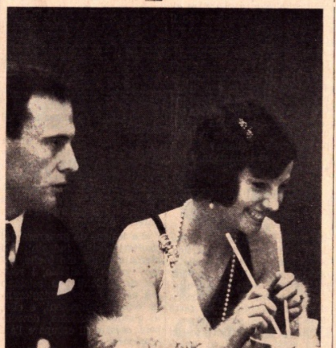
Jean Louis Trintignant, la cui severità espressiva contrasta con quella allegria di Stefania Sandrelli, nel film «Il conformista» diretto da Bernardo Bertolucci che ha tratto dal romanzo omonimo di Moravia