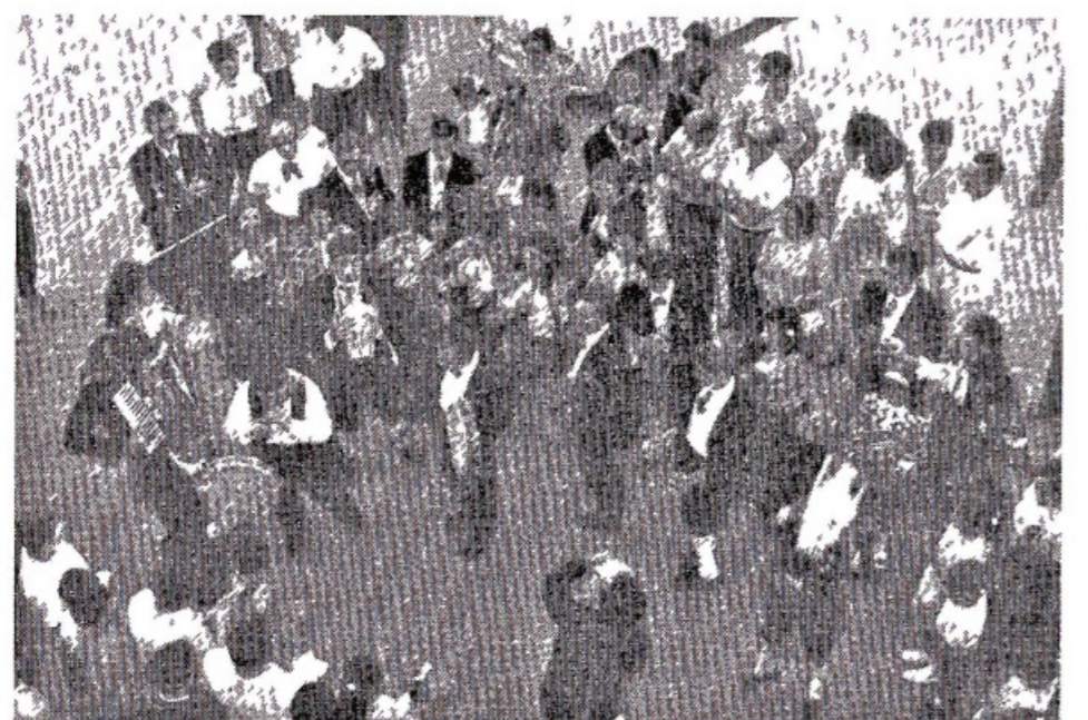
Il complesso folkloristico palermitano in una danza popolare prima dell'inaugurazione della Rassegna