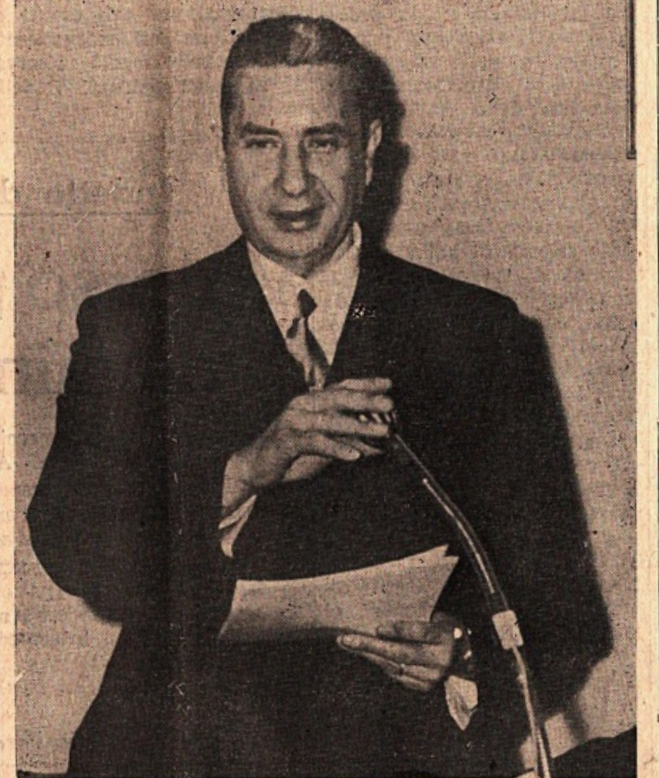
L'On. Aldo Moro

Le nuove norme sulle pensioni sono state varate definitivamente dal Consiglio dei ministri il quale ha in tal modo attuato la delega contenuta nella legge 18 marzo 1968 n. 238 scaturita da una ampia consultazione tra governo e sindacati.