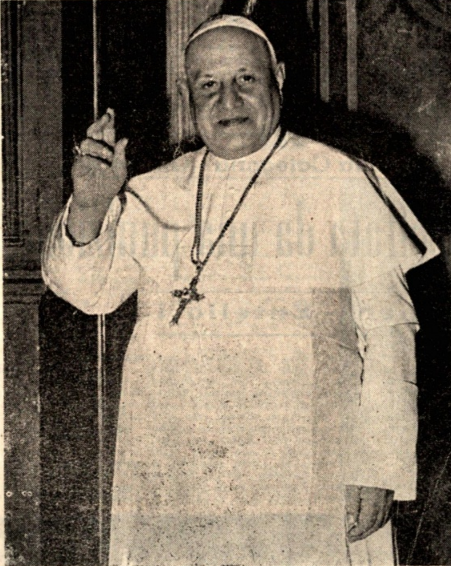
Giovanni XXIII, il Papa della pace