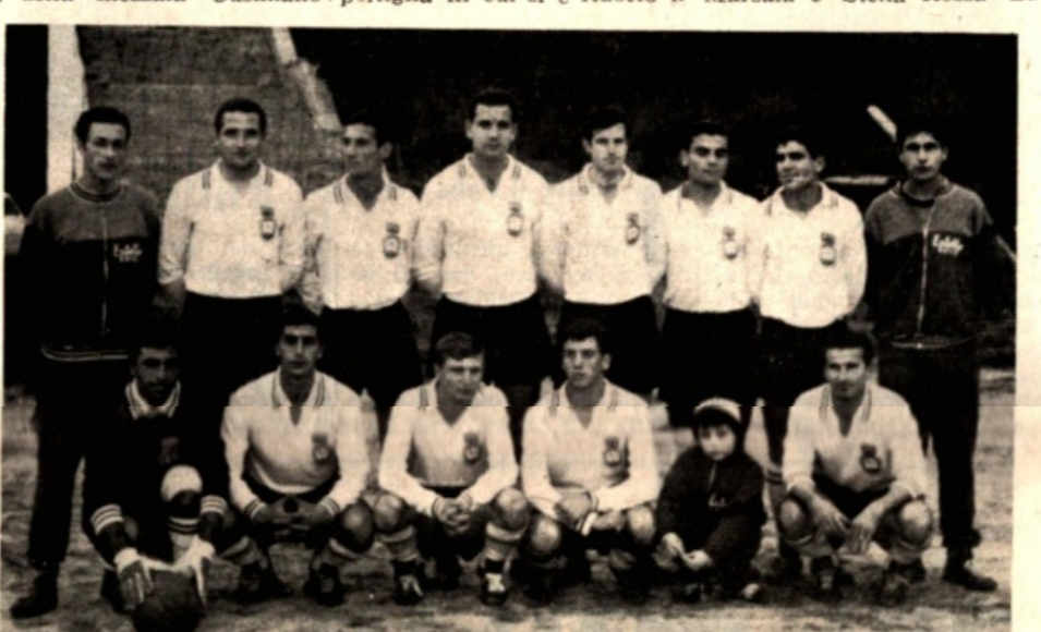
Una recente formazione dell'Entello.

di casa. Armando Alestra Questa la classifica del Girone E della II Cat. alla giornata: Kalsa p. 10; Misilmeri p. 8; Iv. Alcamo p. 7; Entello e Faccio p. 6; Olimpia, Fiamma e Partanna p. 4; Mazarese e Fulgor Sciacca p. 3; Don Bosco Alcamo p. 2; Lib. Lomb. Marsala e Stella Rossa Bar-