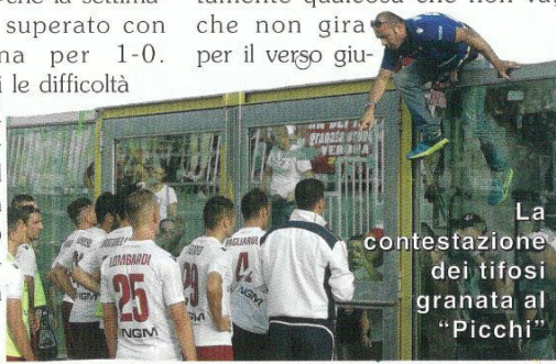
La contestazione dei tifosi granata al "Picchi"