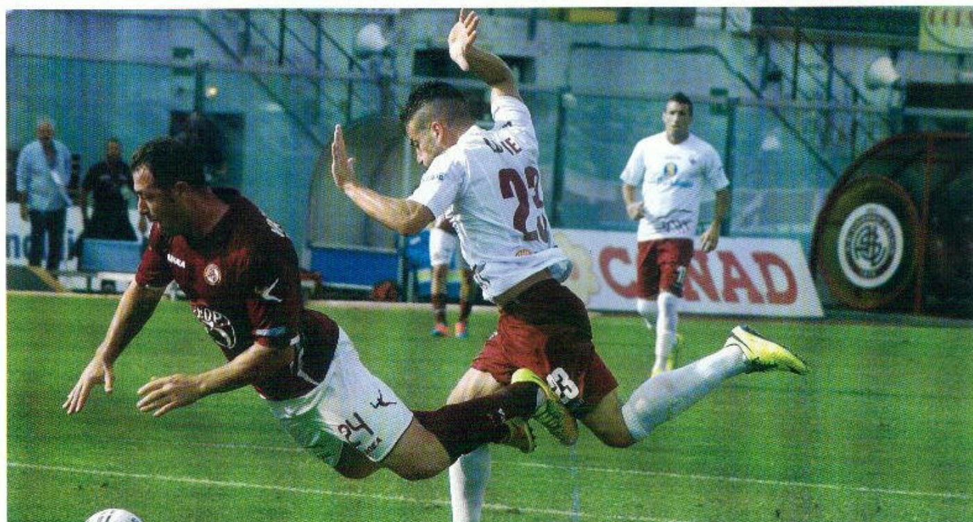
Lo Buc Iocca in area Vantaggiato: rigore per il Livorno!

AUTOVAR NUOVO ED USATO MULTIMARCHE - MICROVETTURE ED AUTOCARRI LEGGERI