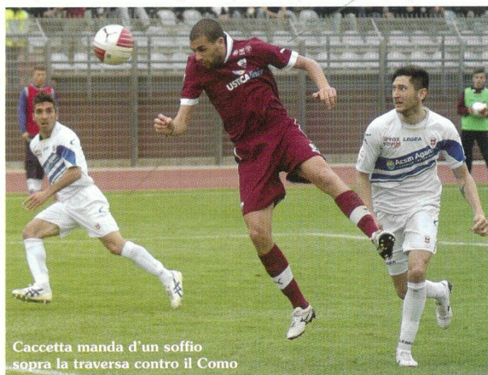
Caccetta manda d'un soffio sopra la traversa contro il Como

Il ragionamento vale, soprattutto, per la prima di queste cinque gare che rimangono, ossia quella con il Pavia (si gioca al Provinciale con calcio d'inizio anticipato alle 14,30).