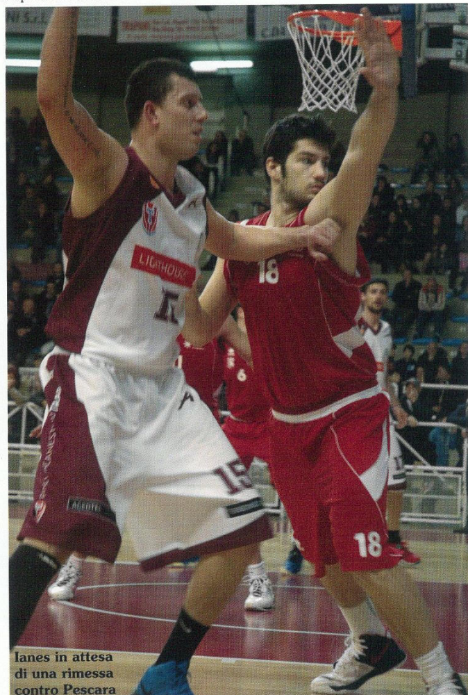
lanes in attesa di una rimessa contro Pescara

*Esempio di finanziamento: SEAT IBIZA SC REFERENCE 1.2 60 CV prezzo promozione € 9.200,00 (chiavi in mano (PT esclusa)). Grazie al contributo dei Concessionari SEAT aderenti. Finanziamento Tasso 0%. Anticipo € 1.200,00, finanziamento di € 8.000,00 in 48 rate da € 166,66. Interessi € 0,00. TAN 0,00%. Risco, IAEG 2,97%. Importo totale del credito € 8.000,00. Spese istruttoria pratica € 300,00. Spese di incasso rata € 3/mese, costo comunicazioni periodiche € 1,00/mese, imposta sostitutiva € 20,00 come per legge addebitata sulla prima rata. Importo totale dovuto dal richiedente € 8.167,00. Includi 2 anni di assicurazione incendio e furto in omaggio. Informazioni europee di base (Fogli Informativi) e condizioni assicurative disponibili presso le Concessionarie SEAT. Salvo approvazione SEAT Credit. L'immagine è puramente indicativa. Consumo di carburante urbano/extraurbano/combinato l/100 km: 7,1/4,4/5,4. Emissioni di CO 2 g/km: 123 (combinato). Dati riferiti a norma SC REFERENCE 1.2 60 CV.