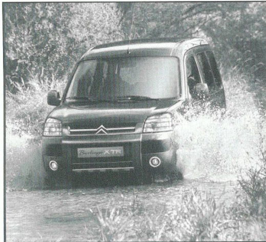
La foto è inserita a titolo informativo.