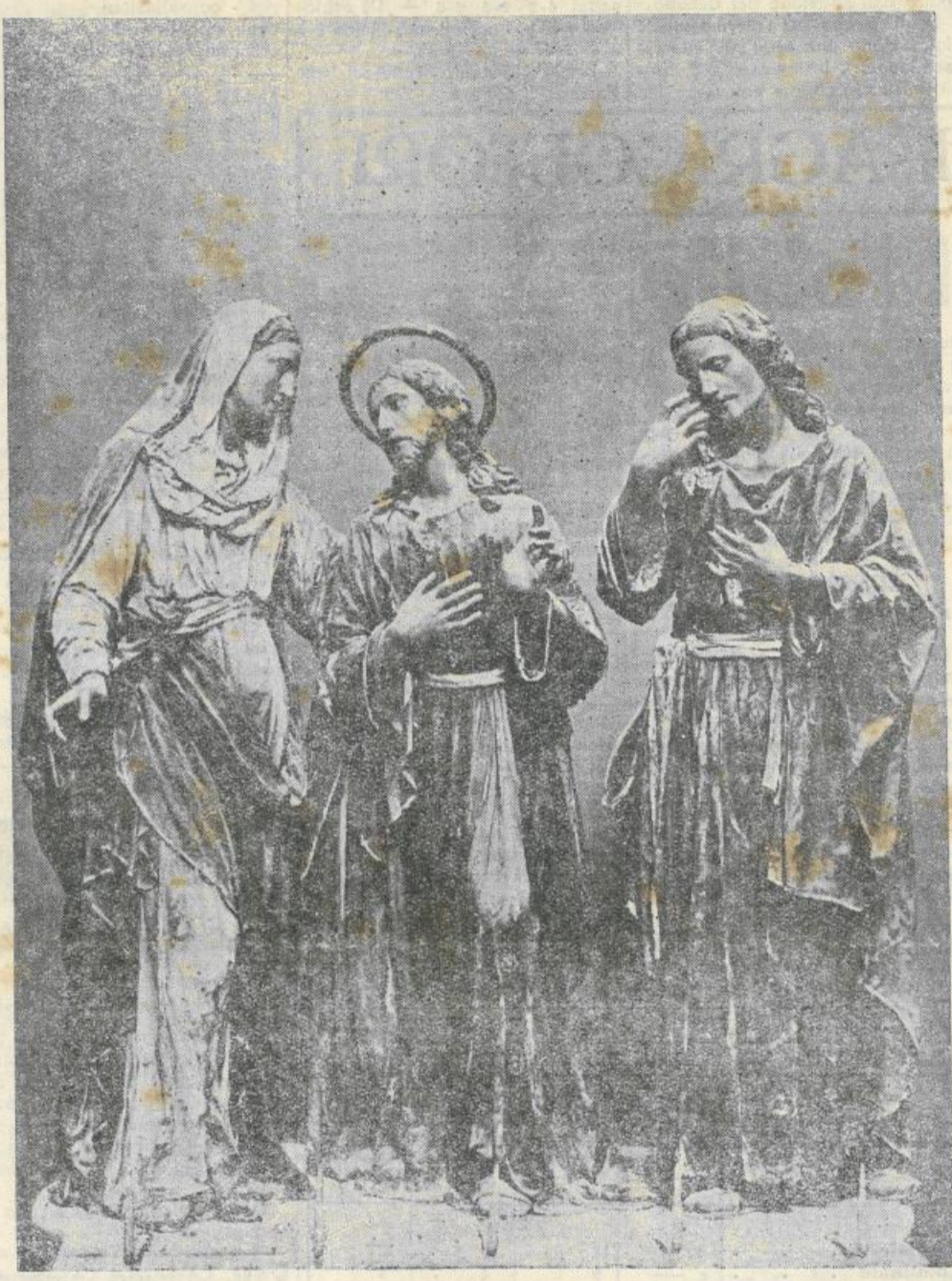
1° Gruppo: «LA SPARTENZA»

ti, Via Barone Sieri Pepoli, Via Carreca, Via Orfani, Via XXX Gennaio, Via Mercè, Largo S. Francesco di Paola, Via S. Francesco di Paola, Via Badiella, Via Aperta, Via Giudeca, Via Api, Largo Tardia, Via Tardia, Via Serraglio S. Pietro, Via XXX Gennaio, Via Osorio, Piazza Umberto I, Via Scontrino, Via G. B. Fardella (Lonerò), Piazza Vittorio Emanuele, Via Garibaldi, Via Torrearsa, Piazza Marina, Via Turreta, Via Cortina, Via Tartaglia, Largo S. Francesco D'Assisi, Via Corrali, Piazza Generale Scio, Chiesa del Collegio.