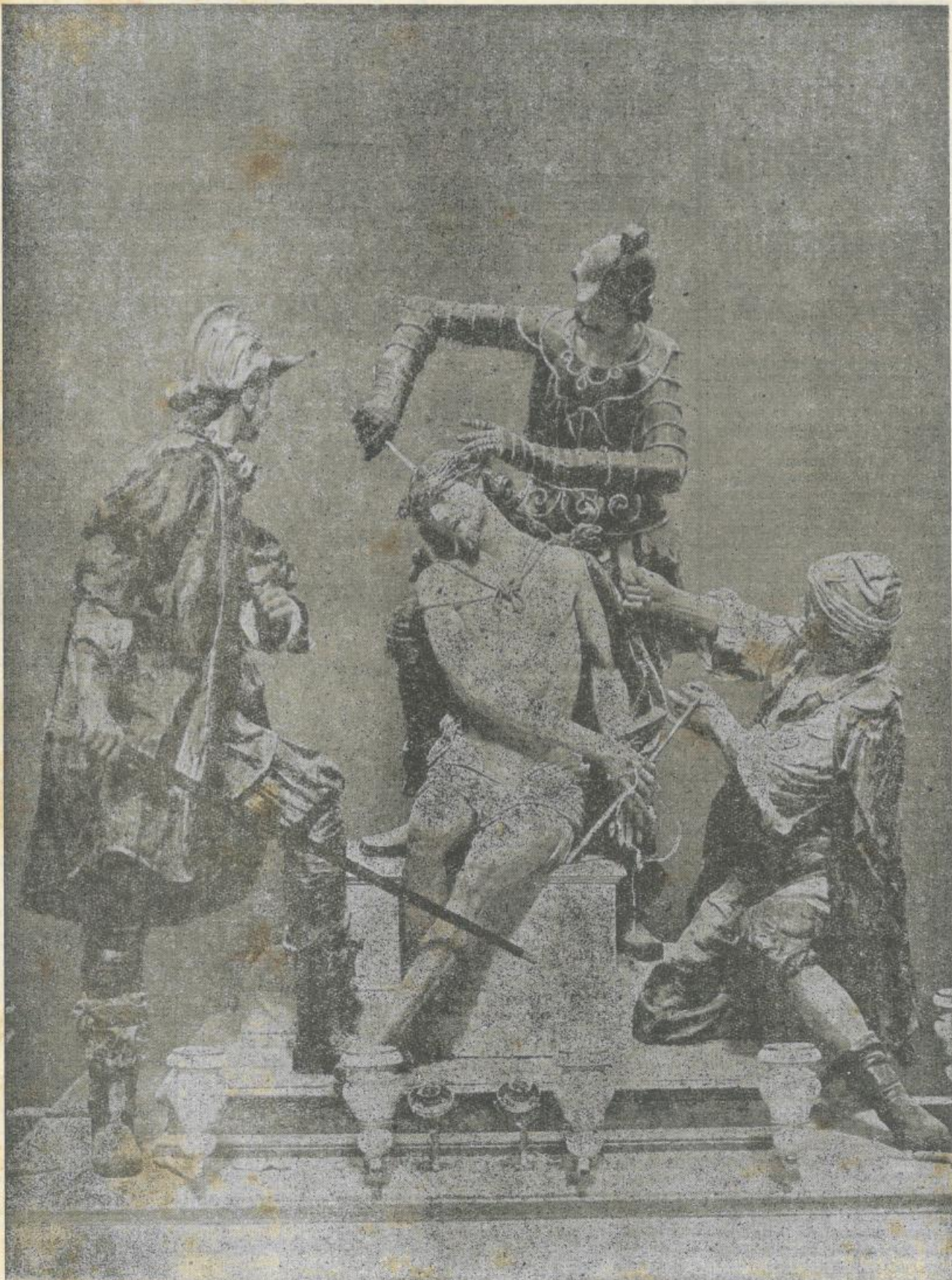
LA CORONAZIONE DI SPINE