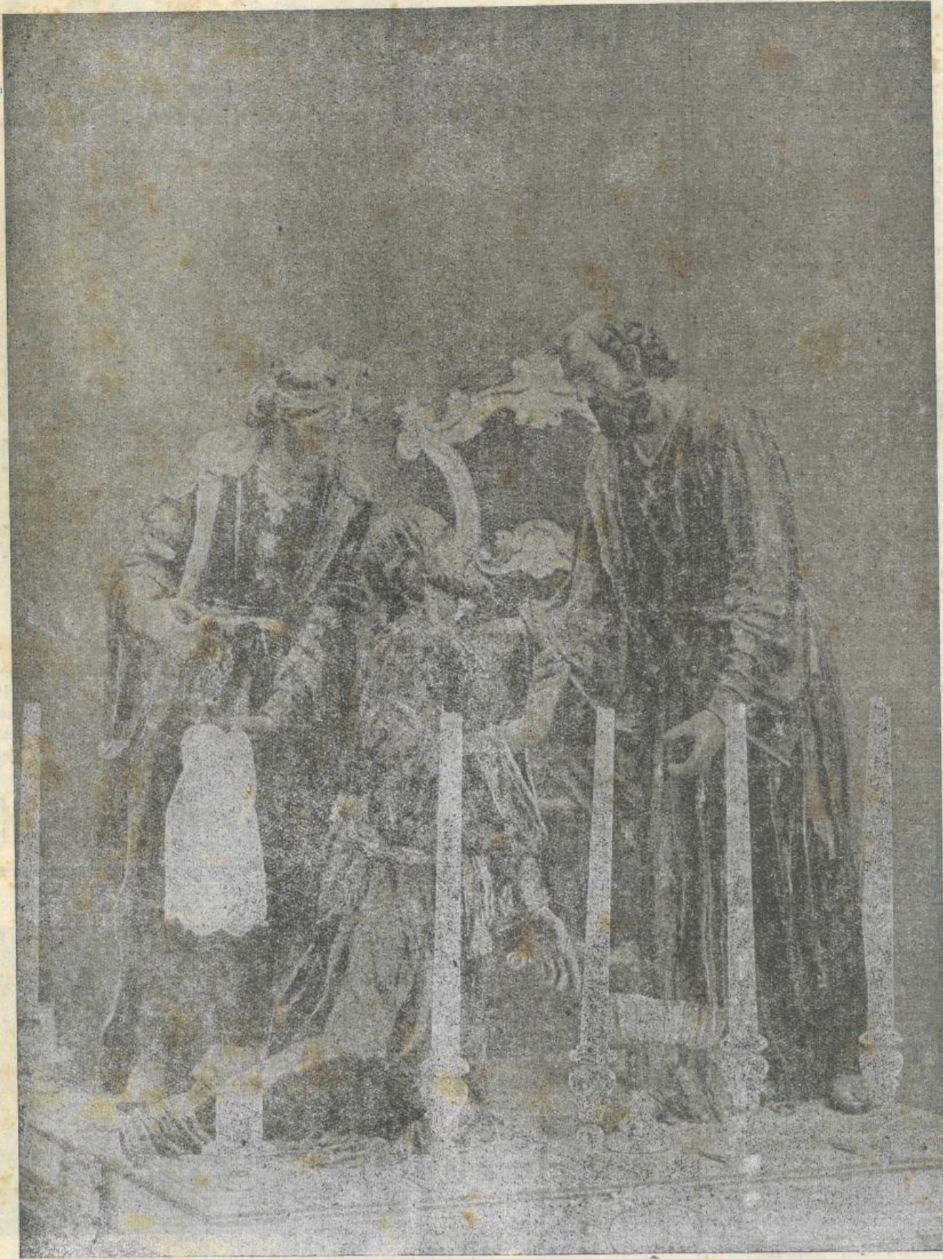
LA LAVANDA DEI PIEDI

La serie completa delle fotografie nell'opuscolo edito a cura dell'Ente del Turismo