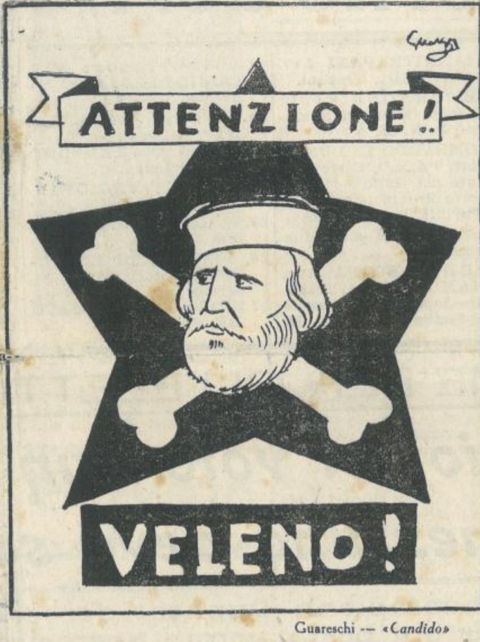
Guaracchi - «Candido»