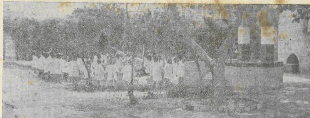
Pare proprio un sogno che in un mondo di egoismi e di violenze si possano ancora trovare angoli di pace e di serenità.