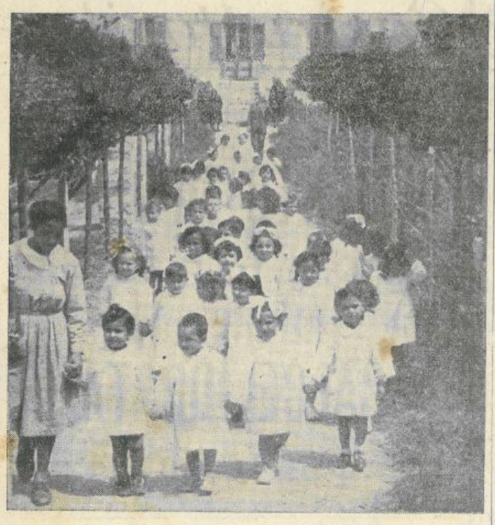
Bimbi sani, allegri, giocondi. Ora rientrano nell'Asilo, a popolare di spensierata allegria il candido refettorio del Centro.