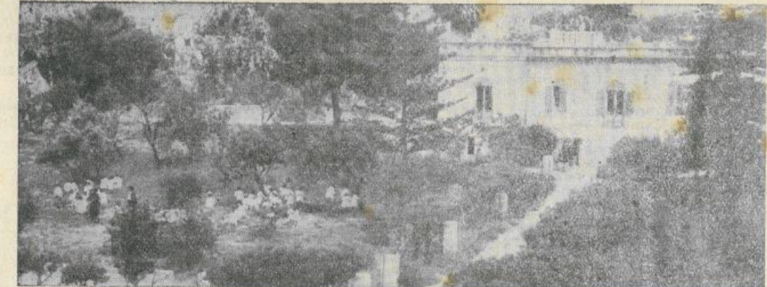
Nell'ampio giardino dell'Asilo, nell'aria profumata dalle ginestre, i bimbi del C.I.F. rinascono a nuova vita.