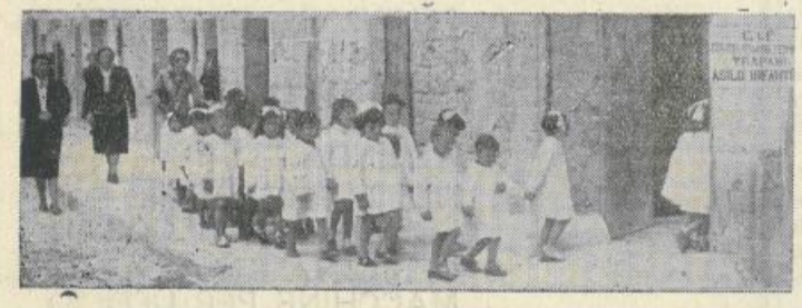
Sotto l'attenta sorveglianza delle maestre i piccoli beneficiari entrano nell'accogliente asilo.