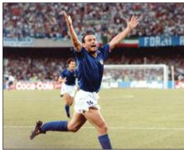
Totò Schillaci a «Italia '90»

e del calcio in particolare». Il consigliere ha però fatto notare il rischio di cancellare l'attuale intitolazione della piazza alle vittime della sciagura aerea del dicembre 1978. «Magari quelli più giovani non lo sanno – ha aggiunto Pellicane –, ma in quella tragedia, che costituisce a tutt'oggi uno dei più gravi disastri dell'aviazione civile in Italia, morirono sette cittadini santaninfesi. A bordo – ha ricordato il consigliere – c'erano infatti intere famiglie che tornavano dal Nord per passare il Na-