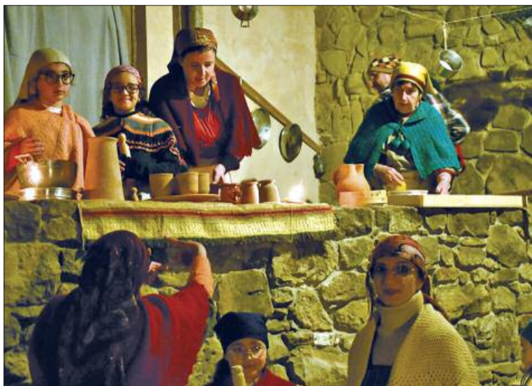
Sopra e a destra due momenti del presepe vivente

Le feste natalizie a Camporeale avranno un'atmosfera gioiosa perché si svolgerà la seconda edizione del presepe vivente. Lo scorso anno è stato un successo, con migliaia di visitatori che sono rimasti entusiasti di avere partecipato a questa sagra dal molteplice significato. Infatti il presepe vivente è segno di fede e religiosità, di storia e tradizioni, di cultura e vita comunitaria. La manifestazione, patrocinata dal Comune, si terrà il 26, 28, 29 dicembre, il 4 e 5 gennaio, dalle 17,30 alle 20,30. Avrà luogo nel rione La Torre, adiacente al lato sud del Baglio dei gesuiti, ora sede del Municipio. Prima del 1646 il Baglio era stato il castello dei Ventimiglia. Poi fu ceduto alla Compagnia di Gesù e, dopo la cacciata dei gesuiti del 1767, il re lo donò al principe Beccadelli insieme ai campi di grano estesi per circa 2.500 ettari. L'ingresso al presepe è dal vicolo Accurso e si snoda lungo le vie Giammalva e Caronia. Il rione Torre è ormai abbandonato dal sisma del '68 ed è il posto ideale perché le case rimaste ancora in piedi sono memoria di una storia passata, di spazi fermi nel tempo in cui rivivrà la vita e il lavoro quotidiano che