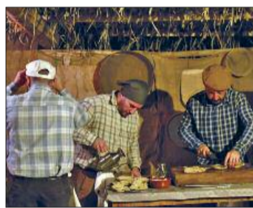
Alcuni figuranti all'opera

trici, i fabbricanti di cannizzi e di ceste di vimini, la famiglia riunita a pranzare, il gioco delle carte nei circoli, chi lavora il formaggio. A Camporeale, città del vino e del legno per le sue cantine e la lavorazione degli infissi di legno, durante il percorso si potranno degustare, oltre al vino novello, i prodotti tipici preparati all'istante: la ricotta gustosa e ancora fumante, le muffulette con l'olio nuovo d'oliva, la zuppa di legumi e anche i buccellati ricoperti di glassa e ripieni con marmellata di fichi secchi o zuccata, di conserva di melone giallo o