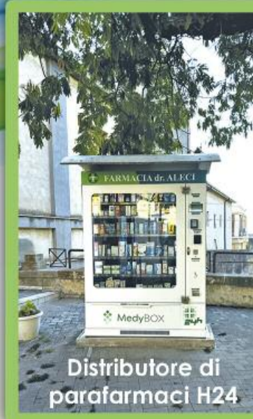
Distributore di parafarmaci H24

Augura Buone Feste con i gioielli anallergici Margutta e Mylovly. Un regalo "prezioso", economico e sfizioso