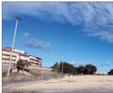
Le torri-faro al campo di Sasi