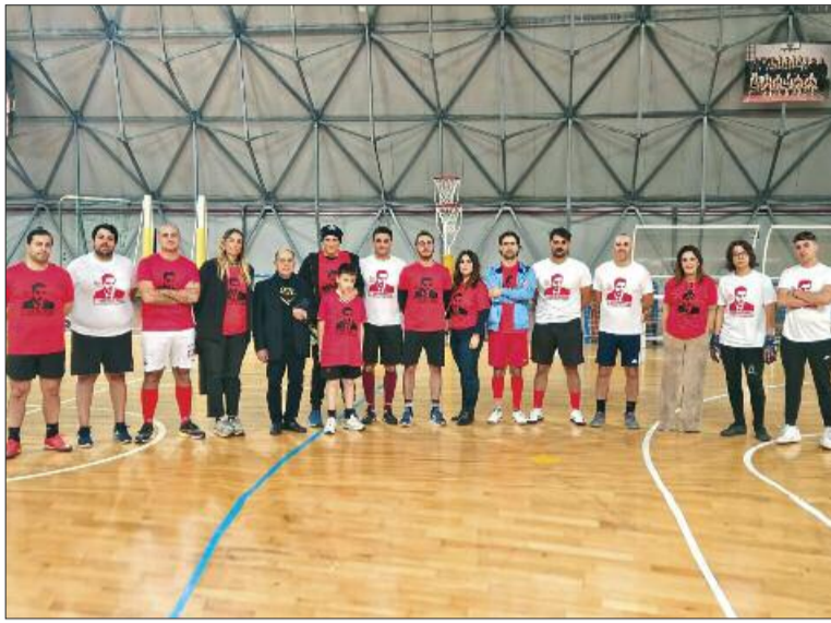
I partecipanti al memorial Milko Palermo

In una fredda e luminosa giornata di novembre, si è svolto con grande partecipazione, al Palazzetto dello sport di Salemi, la terza edizione del memorial calcistico dedicato all'avvocato Milko Palermo. La manifestazione è stata organizzata dall'Ordine degli avvocati di Marsala, la Camera penale, la sezione di Marsala dell'Aiga, il Movimento forense e l'Associazione «Avvocati Valle del Belice» insieme a familiari e amici che hanno avuto il privilegio di conoscerlo. L'incontro, organizzato con grande cura e passione, è stato un omaggio alla sua memoria e un riconoscimento della sua figura di alto profilo umano e professionale. Palermo ha lasciato un'impronta indelebile nel mondo del diritto e nella vita di coloro che hanno avuto il privilegio di averlo conosciuto. Con il suo impegno instancabile e la sua dedizione, ha contribuito in modo significativo alla sua professione, guad-