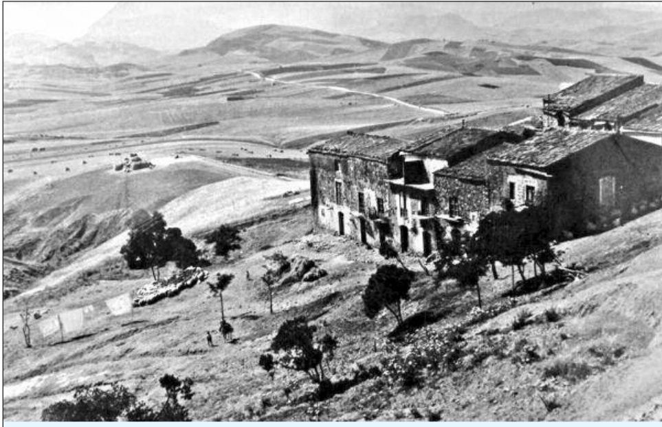
Camporeale, 1950 - Entrata del paese, rione via Triangolo, in una assolata giornata estiva con i panni stesi al sole e sullo sfondo i covoni di grano in attesa della trebbia