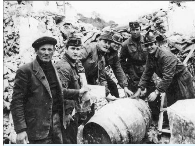
Gibellina, 1968 - Vigili del fuoco all'opera nei giorni successivi al terremoto