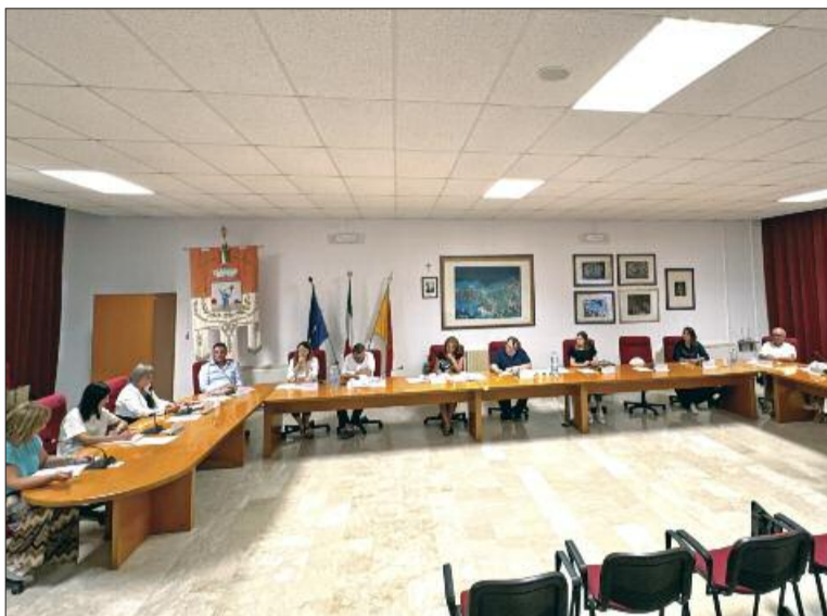
Una seduta del Consiglio comunale; a destra il campo di calcetto

Una targa o una lapide che ricordi le vittime santaninfesi della sciagura aerea del 23 dicembre 1978. La proposta l'ha avanzata il gruppo di opposizione «Insieme per Santa Ninfa», per bocca di Rosario Pellicane, che aveva presentato in aula, in una delle ultime sedute, una interrogazione al sindaco Ferreri per sapere se era intenzione dell'amministrazione cambiare nome all'attuale piazza che ricorda quel tragico evento. La Giunta comunale, infatti, nei mesi scorsi, prendendo atto delle proposte avanzate dalla commissione toponomastica, ha deciso di intitolare il campo di calcio che si trova nella piazza cosiddetta «del Bastione», allo scomparso Totò Schillaci, il calciatore palermitano che fu capocannoniere al campionato del mondo del 1990 morto prematuramente il 18 settembre. Da un punto di vista toponomastico, la piazzetta su cui insiste il campo da calcio è intitolata proprio alle vittime della sciagura aerea del 1978 e la delibera di Giunta che propone l'intitolazione a Schillaci, forse a causa della