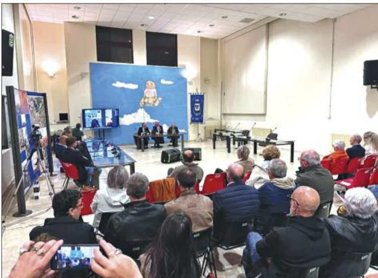
Un momento della presentazione; a destra «La città di Tebe»