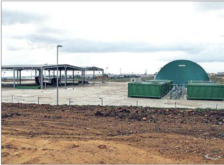
Il Polo tecnologico di Castelvetro; a destra il presidente Schifani

T ra i 338 milioni di euro che la Regione ha perso, ci sono i sei milioni che erano destinati al Polo tecnologico di Castelvetro, oggi di proprietà dei comuni soci della Srr «Trapani sud», che sovrintende al funzionamento del servizio rifiuti nella parte meridionale della provincia di Trapani. Il Polo era stato realizzato, grazie ad un finanziamento comunitario (circa dieci milioni di euro) tra il 2008 e il 2009 e doveva essere, tramite l'allora società d'ambito «Belice ambiente», al servizio dei comuni del territorio per il trattamento della frazione organica e la produzione di compost . In seguito al fallimento dell'Ato Tp2, la struttura era stata gestita da un curatore, che dopo aver tentato vanamente di venderla all'asta, s'era accacciato a cederla ai comuni, che l'anno scorso a novembre l'avevano acquistata per un milione e 400mila euro. Per rimetterlo in funzione occorrono però ingenti somme, che i comuni non hanno. Per questa ragione si è fatta pressione sulla Regione affinché desse una mano. L'aiuto del go-